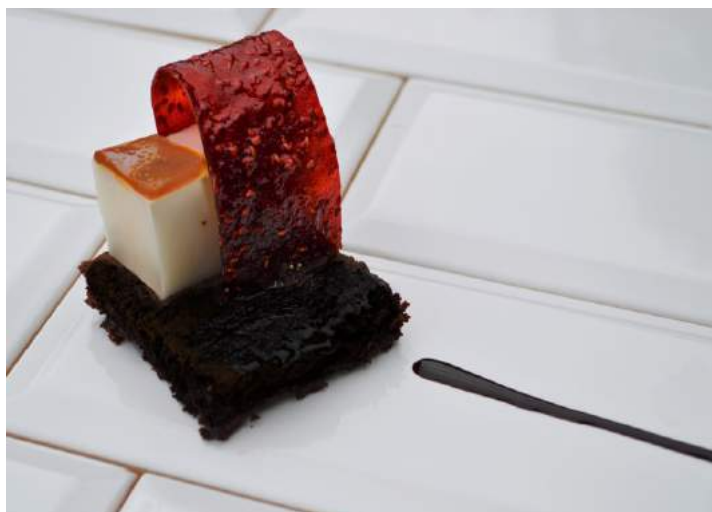
Zwycięskie danie w kategorii „deser” - DOBRO KOBRO z kawiarni Tubajka