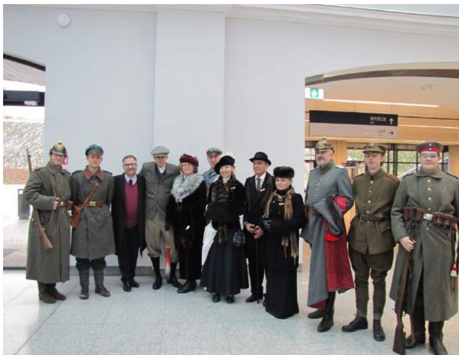
Komplet naszych animatorów podczas inscenizacji 11 listopada