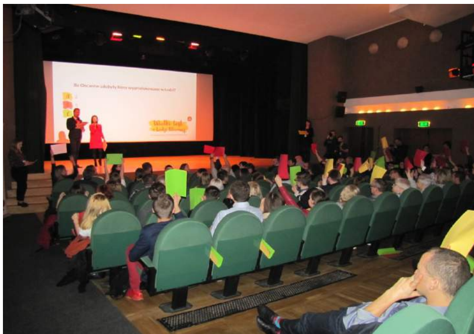
Jeden z dofinansowanych projektów to „Wielki test o Łodzi filmowej” organizowany przez Fundację FKA

Projekt był realizowany w okresie V-XI 2017. Dofinansowanie z UMŁ wyniosło 60 000 zł.