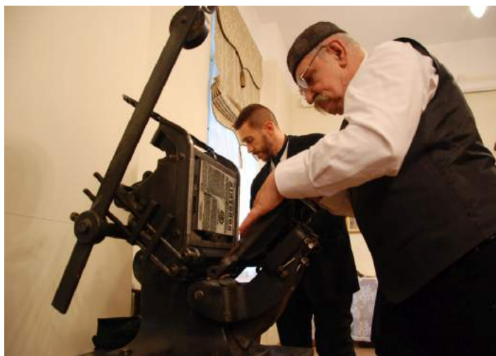
150-kilogramowa „bostonka” wypożyczona na naszą inscenizację