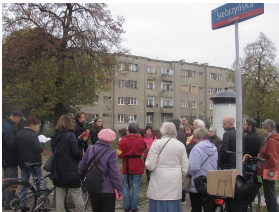
Spacer promujący książkę na osiedlu im. Montwiłła-Mireckiego

Książka dokumentuje zarówno historię oficjalną, archiwalną, jak również tę prywatną, ludzką. Autorom podczas półrocznej pracy udało się dotrzeć do kilkudziesięciu mieszkańców Złotna, Zdrowia i osiedla im. Montwiłła-Mireckiego, aby zebrać ich relacje dotyczące najróżniejszych aspektów dawnego życia tej okolicy. Z książki dowiemy się gdzie były szkoły i kino, jak budowano tu linię tramwajową, czy gdzie zatrzymywały się tabory cygańskie. Tekst wzbogacony został kilkudziesięcioma fotografiami i dokumentami archiwalnymi. Cała książka liczy 184 strony.