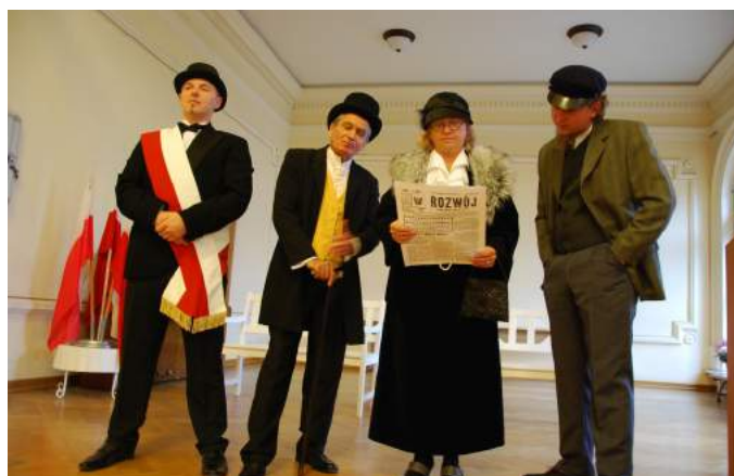
Ceremonia nadania honorowego obywatelstwa Piłsudskiemu

Dodatkowo zajęliśmy się oprawą uroczystości na Dzień Niepodległości dla Łódzkiej Kolei Aglomeracyjnej oraz Urzędu Marszałkowskiego w Łodzi. Naszym zadaniem była inscenizacja odbicia dworca Łódź Fabryczna z rąk niemieckich w listopadzie 1918 r. Tu ponownie wsparła nas niezawodna grupa rekonstrukcyjna Żelazny Orzeł.