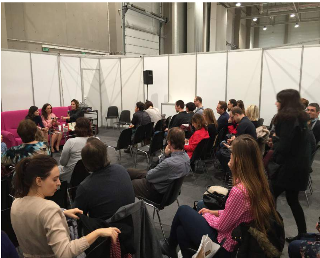
Premiera książki podczas Salonu Ciekawej Książki

Partnerami książki zostali Miasto Łódź, Wydział Filologiczny Uniwersytetu Łódzkiego, Dom Literatury w Łodzi, hotel Stare Kino, EuroEkol, Lecznica Pod koniem, restauracja U Milscha oraz agencja eventowa Acora Events.