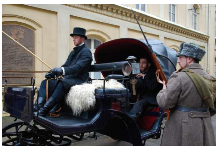
Piłsudski z małżonką przewieziony pod strażą do więzienia