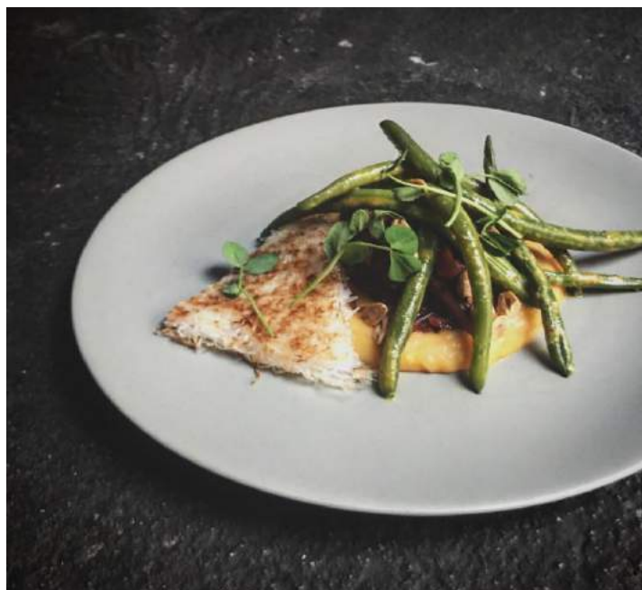
Zwycięskie danie w kategorii „danie główne” - Tajaska Dekonstrukcja z restauracji Zjadliwości