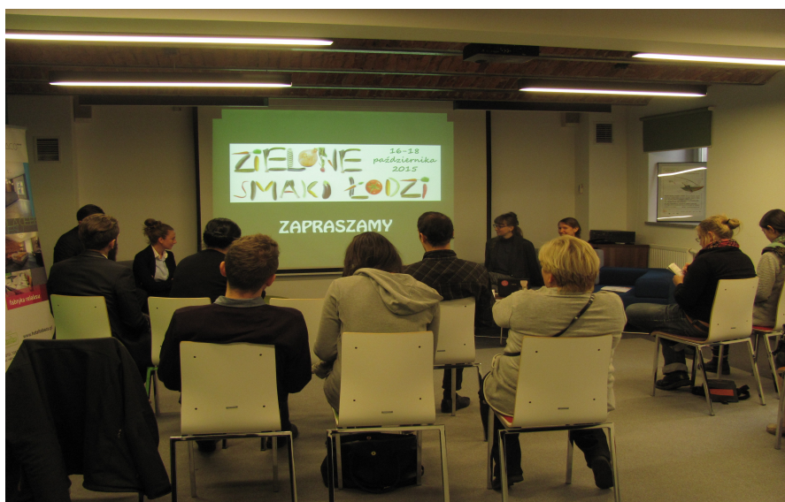
Konferencja prasowa rozpoczynająca Festiwal „Zielone smaki Łodzi” 12.10.2015