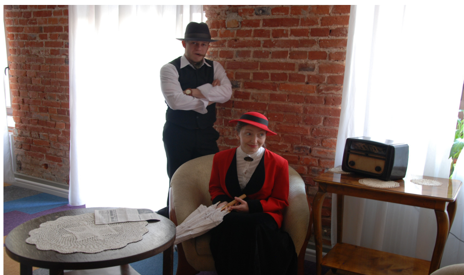
Nasi animatorzy w akcji podczas filmowej gry miejskiej w 2015 roku