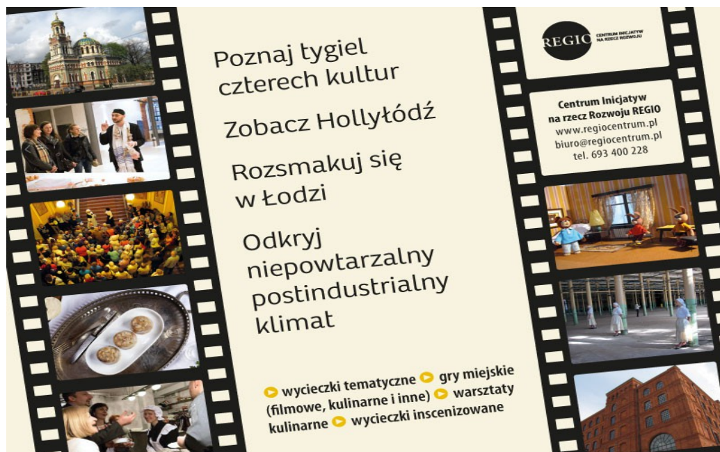
Reklama oferty REGIO w wydawnictwie „Kulturalny event Łódzkie”, s.18

W styczniu nasza reklama ukazała się w wydawnictwie „ Kulturalny event Łódzkie ”, opublikowanym przez portal MeetingPlanner.pl, skierowanym do branży turystyki biznesowej. Zachęcaliśmy do skorzystania z naszych usług, przede wszystkim w zakresie fabularnych gier miejskich, w tym szczególnie przez nas polecanych – o tematyce filmowej i kulinarnej.