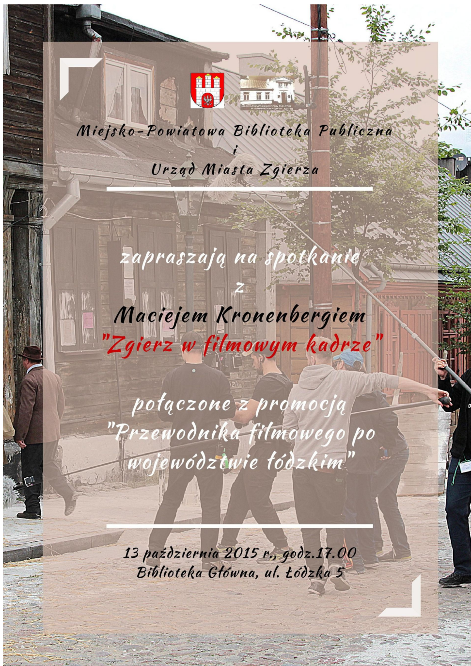
Plakat promujący spotkanie z autorem „Przewodnika filmowego...” w Zgierzu 13.10.2015